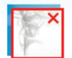
Elimina Fumo e Gas